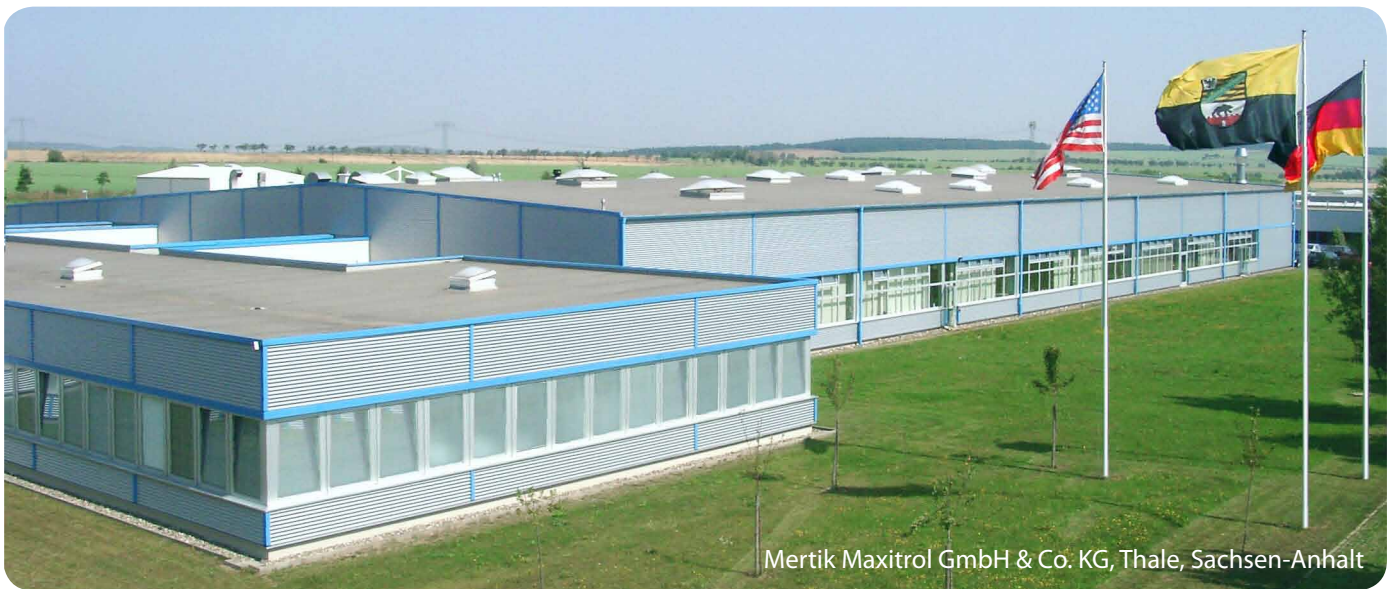
Mertik Maxitrol GmbH & Co. KG, Thale, Sachsen-Anhalt