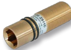
SENTRY GS in einer Montagehülse für erdverlegte Kunststoffgasleitungen