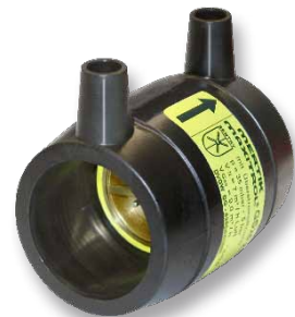
SENTRY GS in einer Elektroschweißmuffe