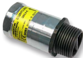
SENTRY GS mit TAE